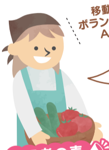
移動販売 ボランティアの Aさん