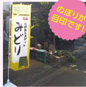
お散歩カフェ「絵のあるスポットみどり」