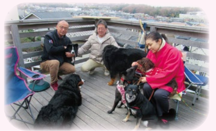
お散歩カフェ「グッデイ Good☆Day」ある日の様子