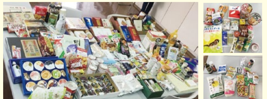
集まった食品です