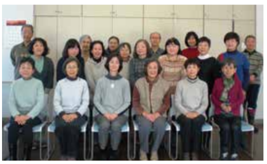
メンバー集合写真

今回、社協だより「みどり」の音声版制作を担当する音声訳・録音グループ「みどり」は視覚障がいや読書が困難な方に、定期刊行物の発行、ご希望の本・新聞・パンフレット等を音声訳でお届けしています。又近年は、選挙広報の音声版も手掛けております。