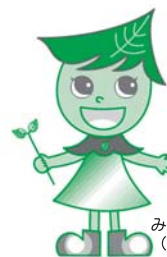
みどりちゃん (緑区社協キャラクター)