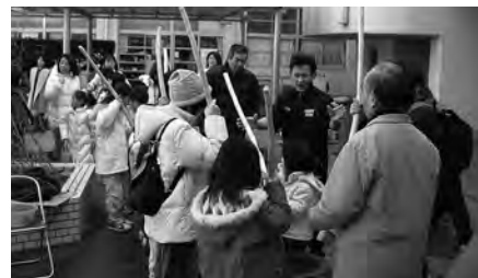
▲子供たちともちつきです。

参加している方々は、活動自体やその後の反省会で多くの知り合いが地域にでき、住んでいて楽しい街になる、そんな実感を持っています。