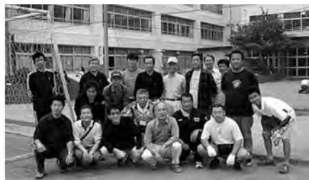
▲メンバーの記念撮影。