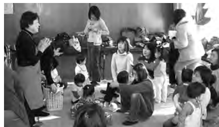
▲今日はクリスマス会。

子育てを地域で支えあう地域づくりの大切さは、言うまでもありません。子育てという地域の交流の場をきっかけとして、より大きな地域の交流の場や機会につながり、広がっていけば、地域の力もより一層強まっていくのではないのでしょうか。