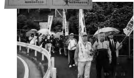
▲平成17年度「あいさつ運動」決起大会。

「あいさつ運動」は平成16年10月から始まりましたが、始まるまで地区の推進会議や実行委員会を立ち上げ、自治会役員会、班長会での説明により実施になりました。この運動には