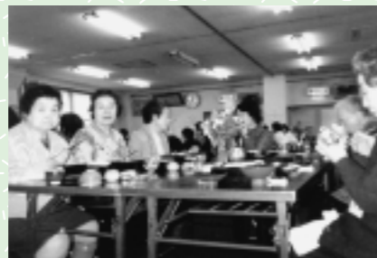
食事会の様子は…？おしゃべりをしたり楽しそうです。食後にはみなさんと歌を歌います。

お食事をつくるボランティアは現在20名。試作会・前日の仕込み・当日と3日間かけて準備します。