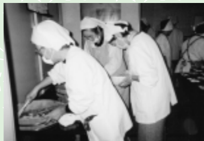
白い割烹着がステキです！！(ボランティアのみなさん)